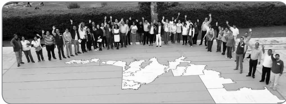
Primer encuentro intermunicipal sobre derechos humanos y vulnerabilidad social en la frontera sur, ECOSUR/INAFED/SEGOB.

En el mismo sentido, ¿qué tanto nos reconocemos como titulares de derechos humanos y los exigimos? ¿Disponemos de las condiciones necesarias para ejercerlos? Un obstáculo es que muchas veces no sabemos con qué derechos contamos o cuál es el proceso para demandar su cumplimiento. Entonces, ¿cómo reducir la vulnerabilidad?