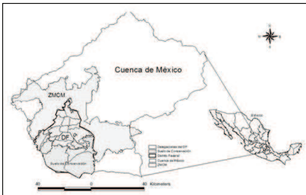
Figura 1: Ubicación del Suelo de Conservación del DF.

Fuente: elaboración propia con base en INEGI (2002)