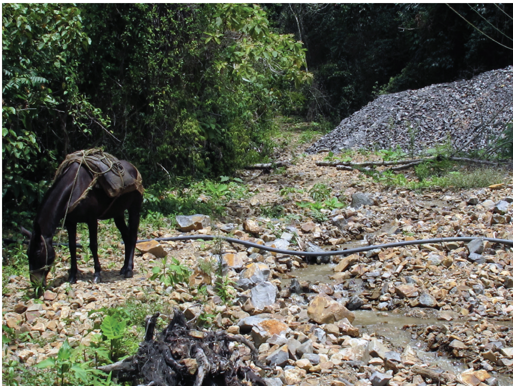
Figura 2: Disminución de la fuente hídrica “Quebrada Careperro”, tras la ejecución por décadas de la acción minera en el corregimiento de Güíntar, municipio de Anzá, Antioquia, Colombia