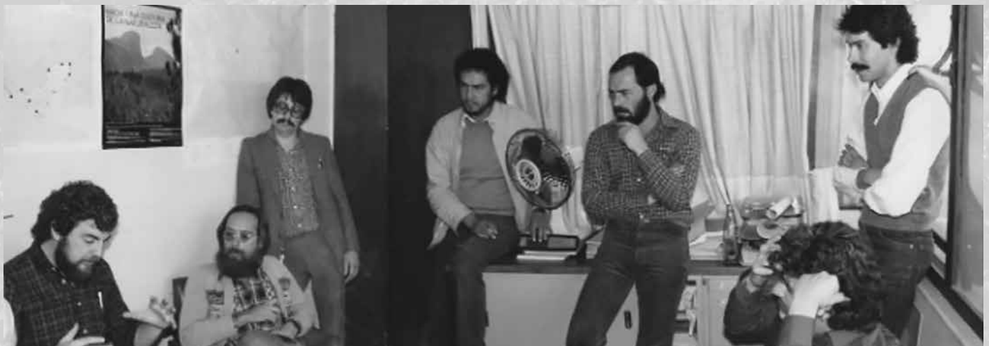
Biólogos que ayudaron en la formación de la Reserva de la Biósfera Calakmul.

Las limitantes de información para el programa pretendían ser superadas mediante fondos internacionales para obtener datos mínimos necesarios. Desde 1988 la World Wildlife Fund y The Nature Conservancy, a través de Pronatura Península de Yucatán A.C. y de Ecosfera A.C., apoyaron estudios que aportaron datos sobre vegetación, aves, mastozoología, fisiografía y cartografía, aspectos sociales, económicos y usos del suelo. Por su parte, la UAC, a través del CIHS y con el apoyo de Biocenosis A.C., Conservación Internacional y la Fundación MacArthur, profundizaron en cuestiones de arqueología, climatología e hidrología, y sus implicaciones en los patrones de uso del suelo.