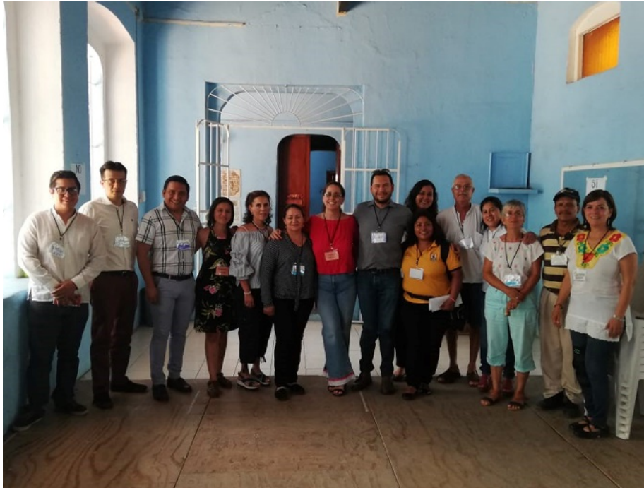
Figura 5. Participantes en los talleres de turismo cultural sustentable, San Andrés Tuxtla, Veracruz, México