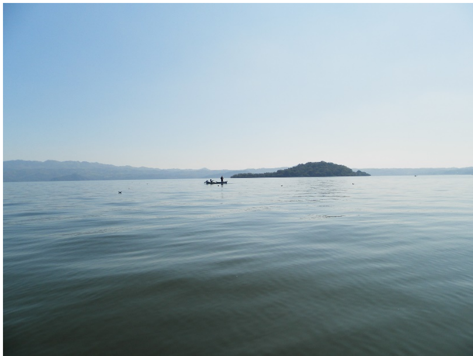
Figura 4. El lago de Catemaco en los Tuxtlas, Veracruz, México