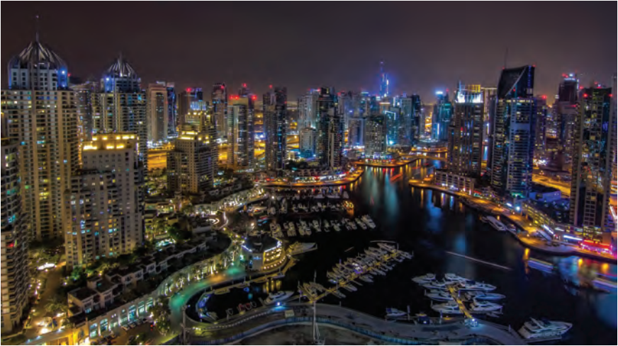
Dubái. Estéticas de la ocupación impoética.

y se abraza emotivamente la dominación tecnológica del planeta. Una vez al discurso humano le es exprimido el lenguaje de la tierra, una vez nuestra lengua común es arrasada y violada, terminamos siendo robados de la experiencia que nos ha hecho humanos, porque, incorporados en la terminología abstracta, economicista y gerencial del lenguaje modernizador, acabamos, como sugiere Abram (1996), por alejarnos de las voces y los gestos del paisaje vivo, y por dirigir toda nuestra atención a los artefactos y las tecnologías ofrecidas en el mercado.