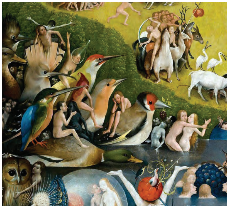
Cabalgando sobre la lengua de las aves. El jardín de las delicias (fragmento), Jheronimus Bosch.

Las investigaciones más recientes sobre el origen del lenguaje humano han venido a confirmar esta certeza fenomenológica y espiritual de los pueblos de la tierra, al asegurar que, probablemente, el habla fonética articulada surgió por imitación de los ruidos de la naturaleza, y en particular, del canto de las aves. Se ha descubierto que los humanos y las aves comparten grandes similitudes, como lo es un sistema de neuronas espejo —relacionado con las capacidades de aprendizaje oral— (Jarvis, 2004), así como un gen homólogo —el gen Foxp2 — (Teramitsu et al. , 2004). Estas coincidencias anatómicas y genéticas, han venido a