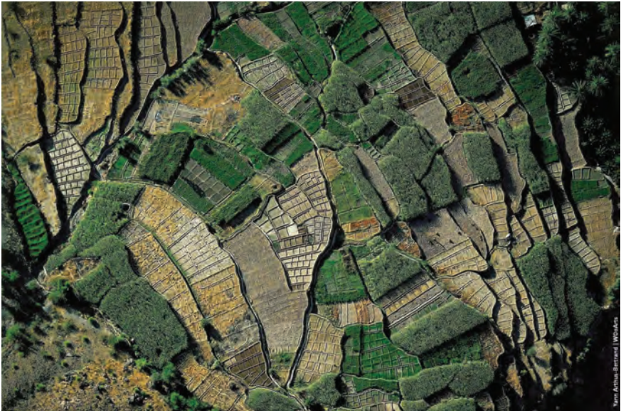
Paisaje agrícola k'iche, Guatemala.

A lo que queremos llegar es a que la fenomenología de los saberes ambientales, como en las agriculturas tradicionales, responden precisamente a este sentido vernáculo: la percepción aguda de las proporciones, de los equilibrios, de la configuración de lo que se considera bueno, así como el sentido de todo aquello que se encuentra desproporcionado. Basta ver los jardines agroecológicos tropicales para entender el sentido estético de las fincas bien diversificadas, los arreglos florísticos que