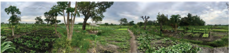
Machamba en Matola, provincia de Maputo, Mozambique.