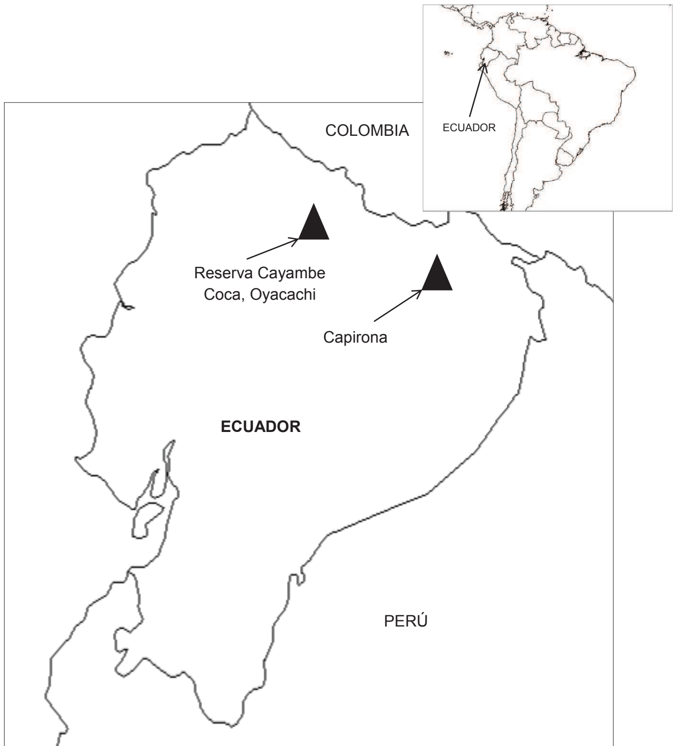
Anexo 1.3 Ubicación de casos de estudio en Ecuador (Elaboración propia).