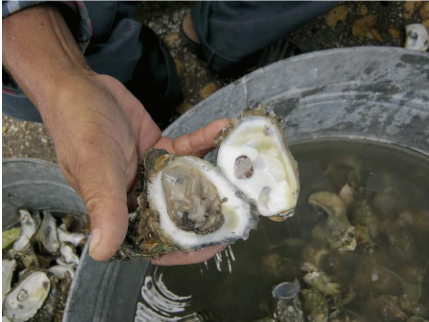
En la laguna están los ostiones para comer en cocktailito. Ahí están las conchas, se tienen que guardar, para volverse a regresar al agua, para que vuelva a producir otra vez. (Narración y fotografía) Socorro Espinoza Jiménez, Socia de Club Playero.