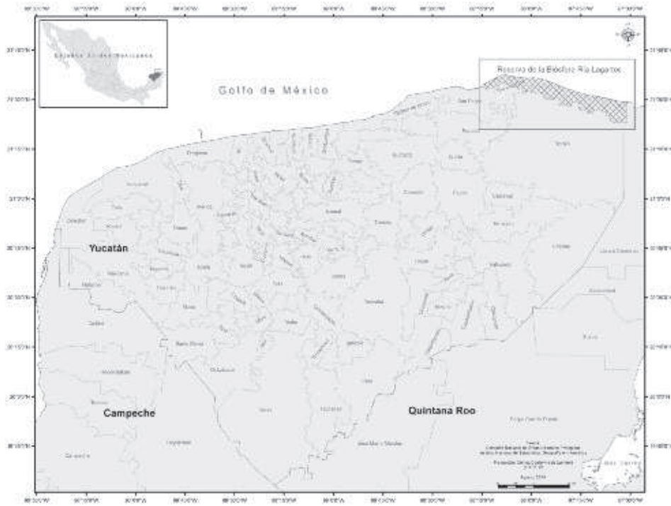
Figura 1. Ubicación de la reserva de la biósfera Ría Lagartos, Yucatán, México