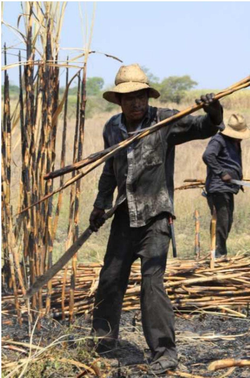
Cortador, Veracruz, México