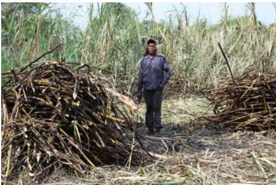
Puños de cortador